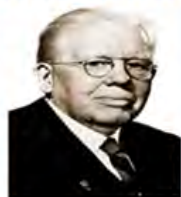
Melvin Jones fundador

A Associação Internacional de Lions Clubes nasceu como o sonho de um empresário de Chicago chamado Melvin Jones, que acreditava ser os clubes comerciais locais que deveriam expandir seus horizontes puramente profissionais, para o bem-estar das comunidades e do mundo como um todo. O grupo concordou. Em uma reunião organizacional que foi realizada em 7 de junho de 1917 em Chicago, Illinois, EUA. O grupo adotou o nome de "Associação de Lions Clubes" na 1ª. convenção nacional realizada em Dallas, Texas, EUA, em outubro do mesmo ano. Um estatuto, regulamentos, objetivos e um código de ética foram aprovados.